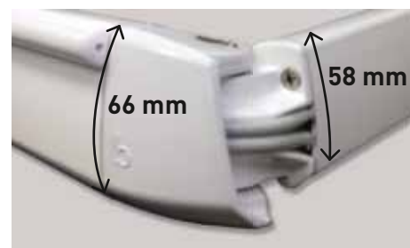
Bras articulés B-25 standard avec hauteur de 66 mm et 2 câbles.

Le store banne B-27 est une variante avec boîtier rectangulaire convenant parfaitement pour les maisons modernes. Pour plus d'information : voir page 11.