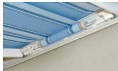
Pour l'assemblage d'un store couplé, un couvre-joint est livré.