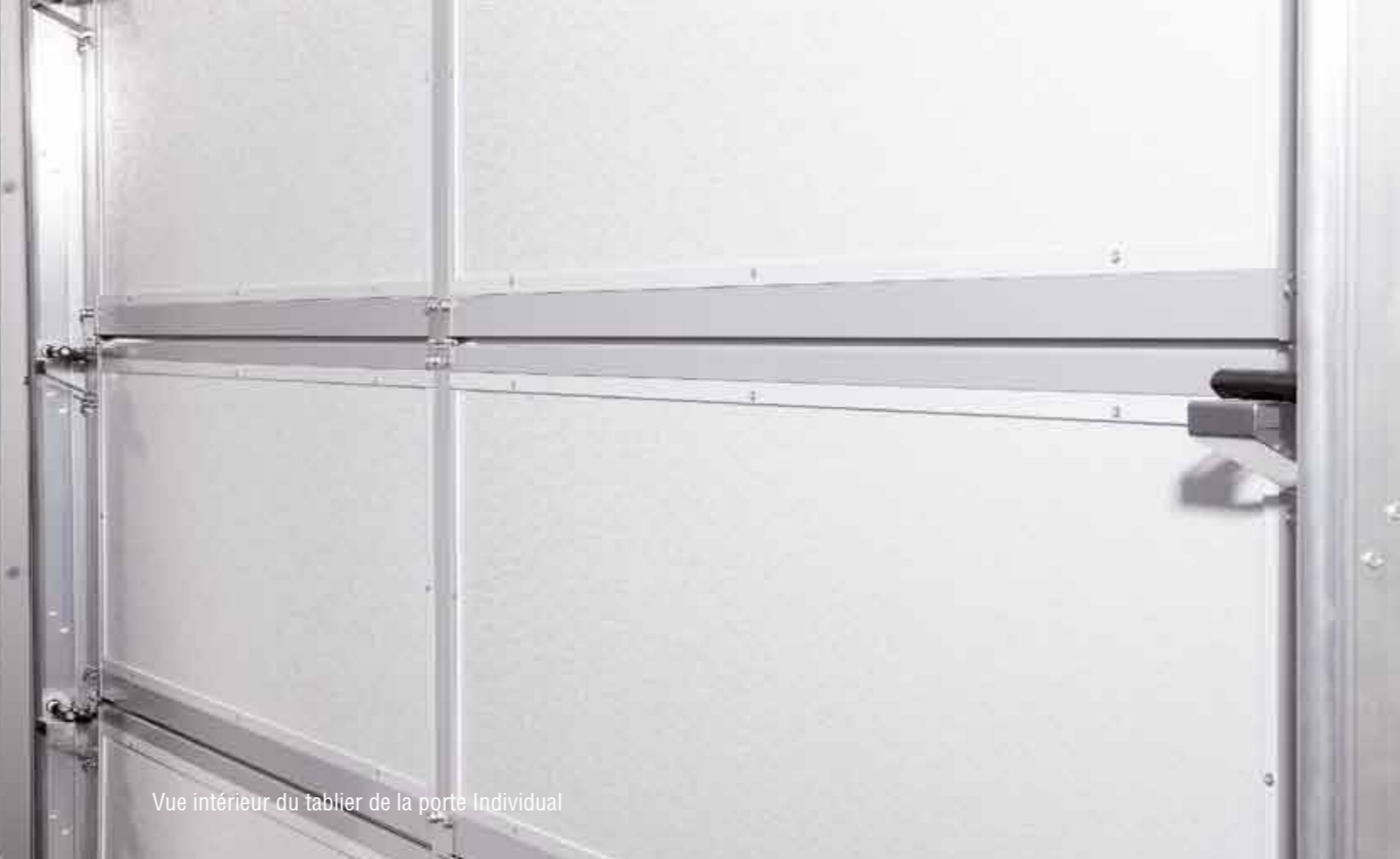
Vue intérieur du tablier de la porte Individual